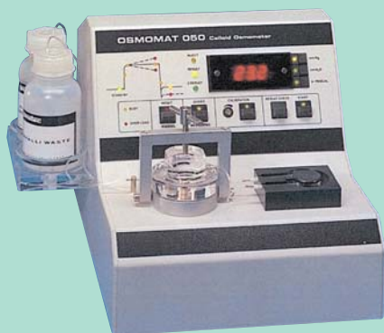
コロイド浸透圧計