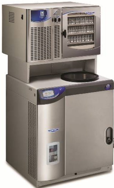
FZ-6 シリーズ+STD 組み合わせ型 (除湿量 6L+棚チャンバー)