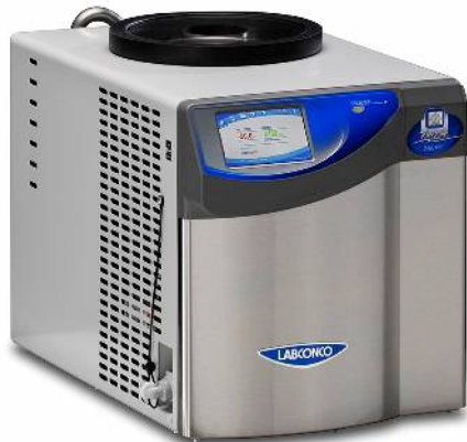
FZ-2.5 (除湿量 2.5L) シリーズ

2017年7月3日国内販売開始！ *お客様への納入は8月下旬を予定しております。