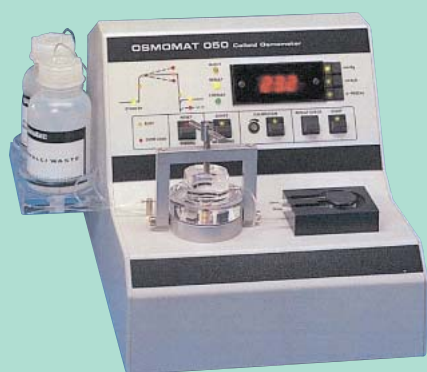
コロイド浸透圧計