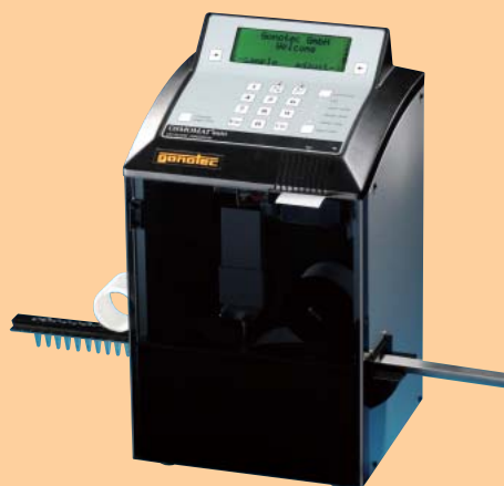
多検体用 (氷点降下法:3点校正式)