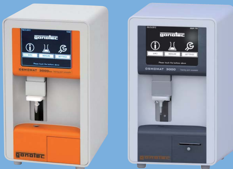
氷点降下法 (2点/3点校正式)