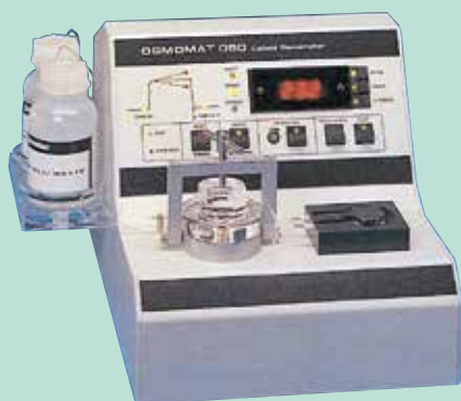
コロイド浸透圧計