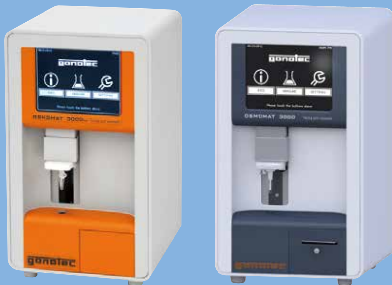
氷点降下法 (2点/3点校正式)