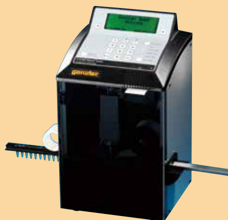
多検体用 (氷点降下法:3点校正式)